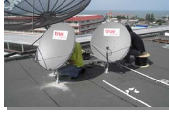
เปลี่ยนระบบสัญญาณ UBC จาก S Band เป็น L Band