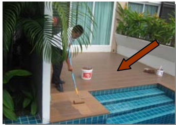
ทาสีระเบียงหน้าห้องลูกบ้าน