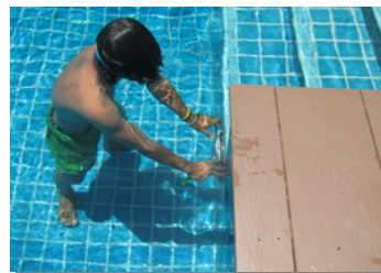
เปลี่ยนหลอดไฟระย้าว่ายน้ำ