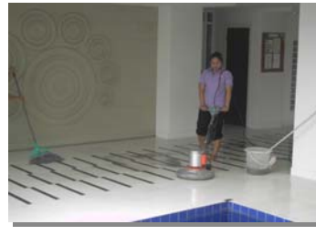
ขัดร่องกระเบื้อง ขัดเงาพื้น ชั้น 1-8