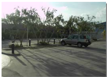
ปลูกต้นไม้ซอกกานีบริเวณลานจอดรถเพื่อให้ร่มเงา